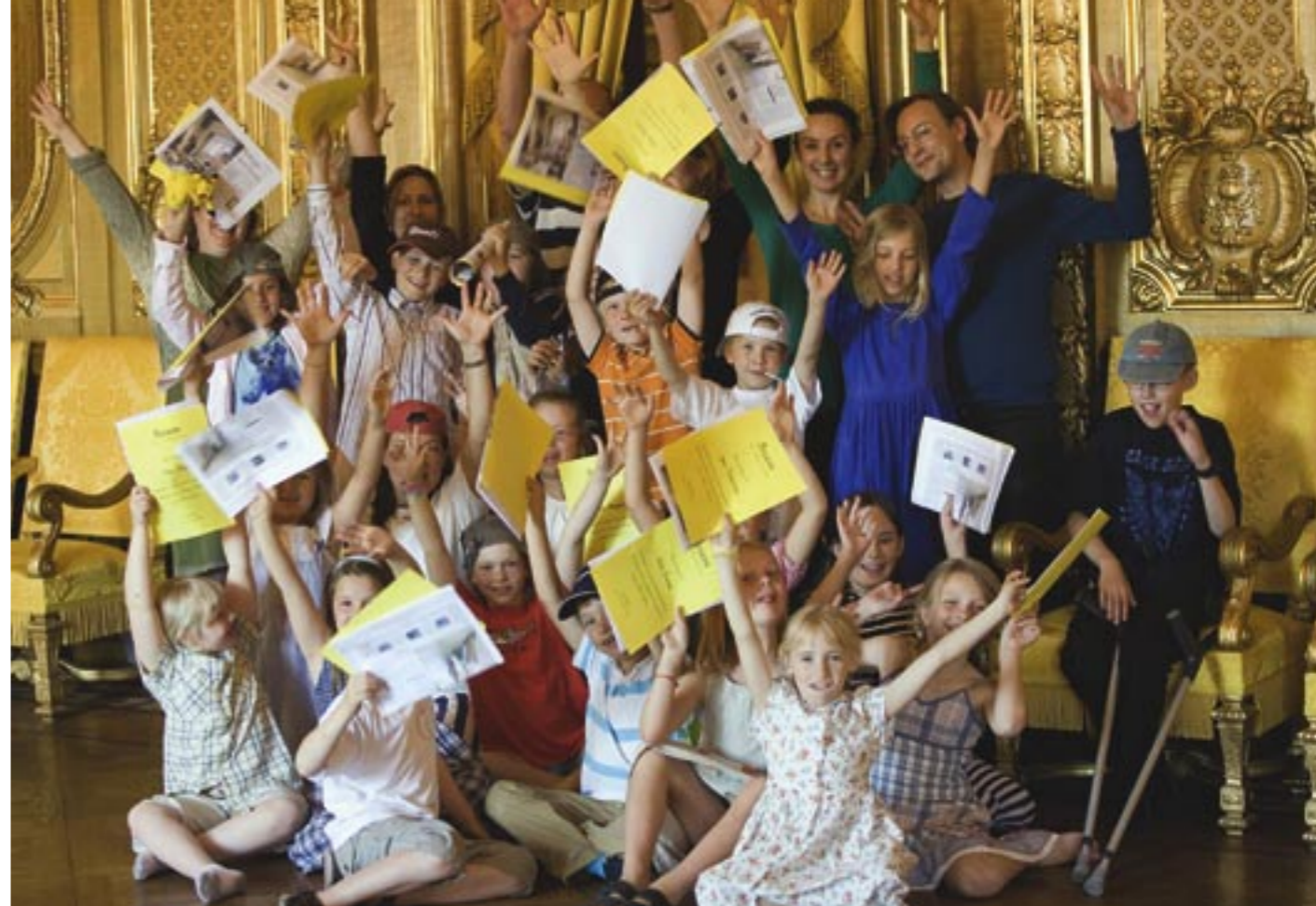
Sommarkollo med Unga på Operan.

Inga utskott har utsetts utan samtliga ärenden be-